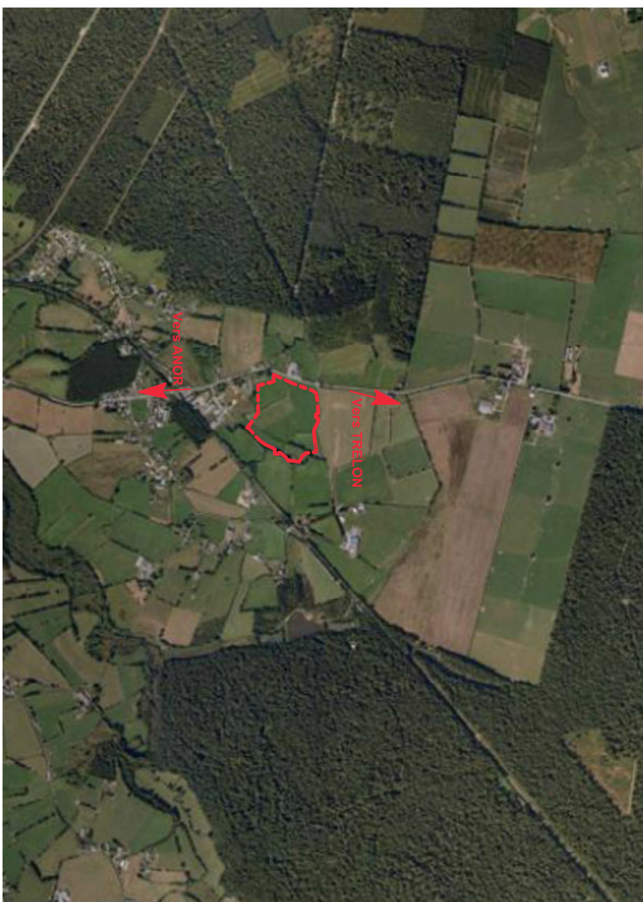
Limite approximative du site