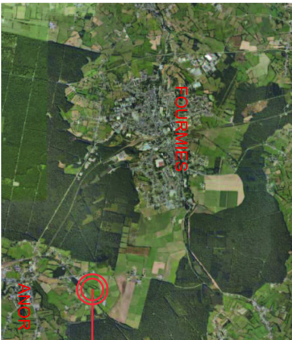
Site du Projet